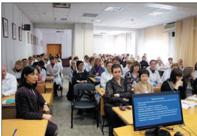
Образовательный семинар на кафедре

При этом традиционно большое внимание уделяется вопросам физиологии и патологии раннего возраста, иммунологии и нутрициологии, гастроэнтерологии и нефрологии. Результаты исследований сотрудников кафедры не только представляют на научных форумах и публикуют в специализированных изданиях, но и включают в лекции и семинары, проводимые на циклах для практикующих врачей.